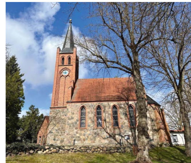
Die Kirche wurde 1861 errichtet, ersetzte den marode gewordenen Vorgängerbau.