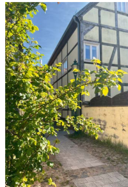
Der Rosenhof – die Geschichte, wie er zu seinem Namen kam, ist nicht genau belegt.

hinzü, die sofort hängen bleibt: »Sein Schwert, das Zeichen des Stadtrechtes und der Gerichtsbarkeit, war sogar schon einmal verborgen.« Mehr braucht es nicht, um Lottes Fantasie anzukurbeln. Von der Statue führt der Weg weiter durch die Stadt – oder besser gesagt: über die Stadt. Denn Perleberg wurde nicht ohne Grund in früherer Zeit das »Klein-Venedig des Nordens« genannt. Viele Wasserläufe der Stepenitz und zahlreiche Brücken prägten einst das Stadtbild. Eine davon ist die