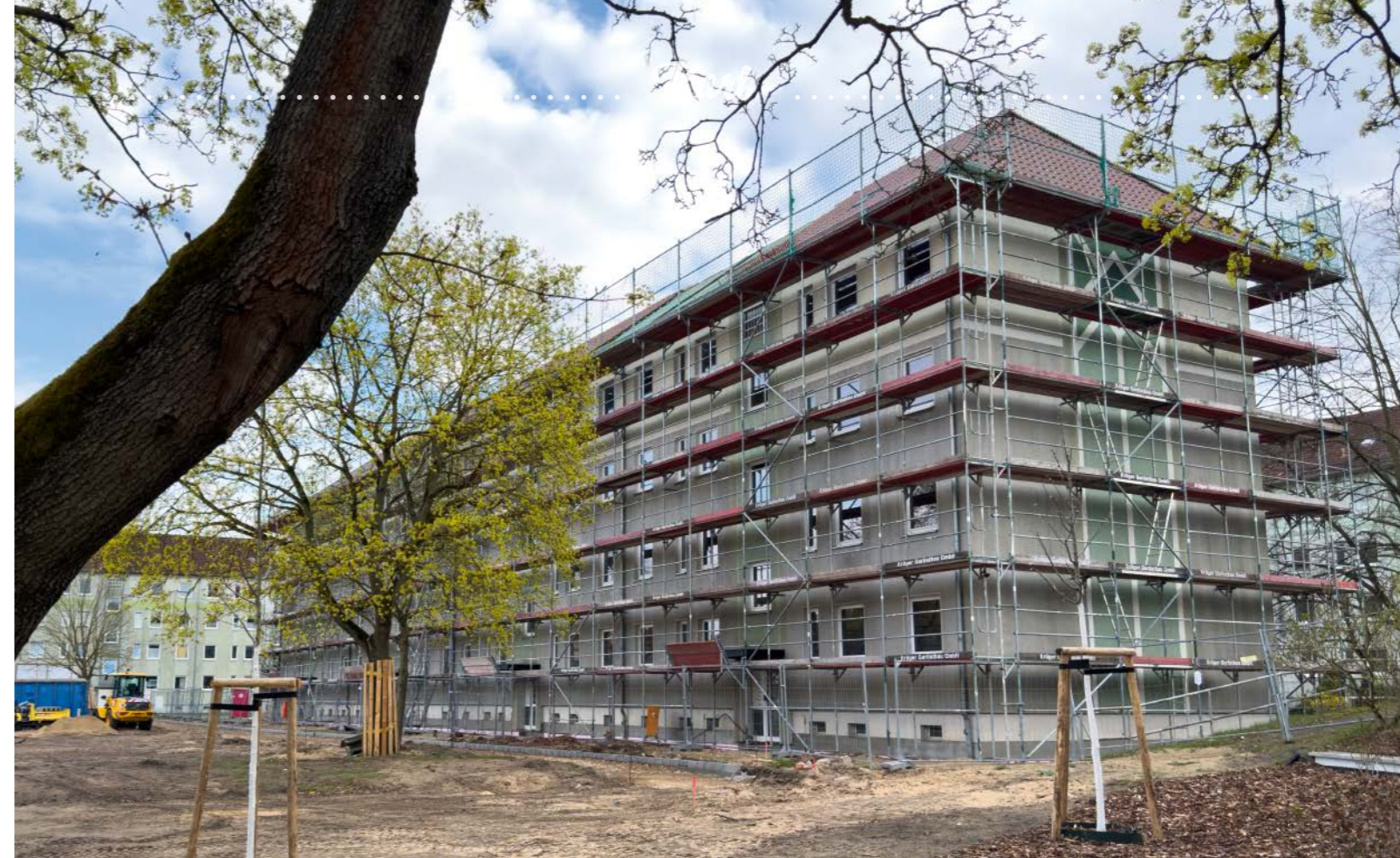
Der Modellblock in der Straße der Einheit. Dank des geförderten Komplettumbaus entstehen hier 22 neue komfortable Wohnungen.

Mit dem Umbau der Häuser entstehen großzügigere Zuschnitte, die Anzahl der Wohnungen verkleinert sich, in den Eingängen 20–26 beispielsweise von ursprünglich 36 auf 22. »Das ist einer der Wege, unseren Wohnungslieferstand zu verringern«, so Elverich. Denn 20 Prozent der Genossenschaftsdomicile sind momentan nicht ver-