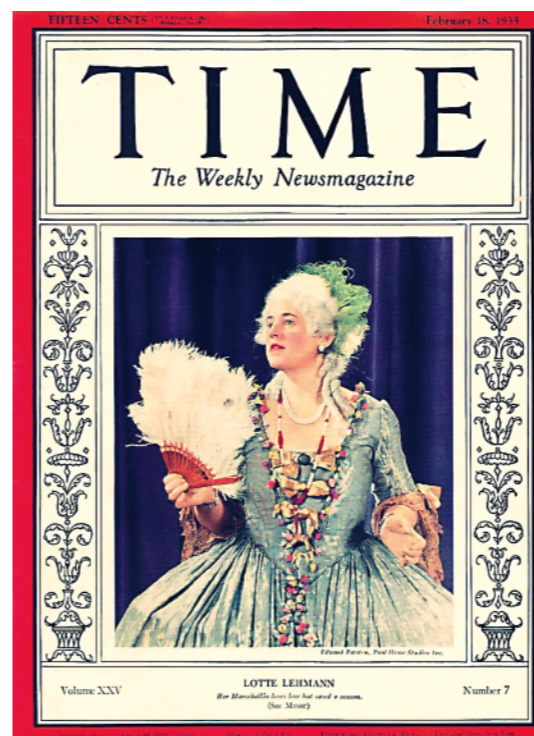
Lotte Lehmann im Kostüm der Feldmarschallin im »Rosenkavalier« zierte den Titel des »Time«-Magazins vom 18. Februar 1935.