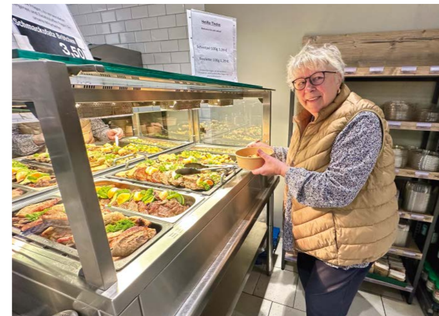
Anziehungspunkt im Markt ist die »Heiße Theke«. Eine Kundin stellt sich ihr Mittagessen zusammen.

EDEKA Misigaiski August-Bebel-Straße 2 19348 Perleberg Telefon 03876 3073085 misigaiski.nord@edeka.de Öffnungszeiten Mo – Fr 6 – 20 Uhr; Sa 6 – 18 Uhr