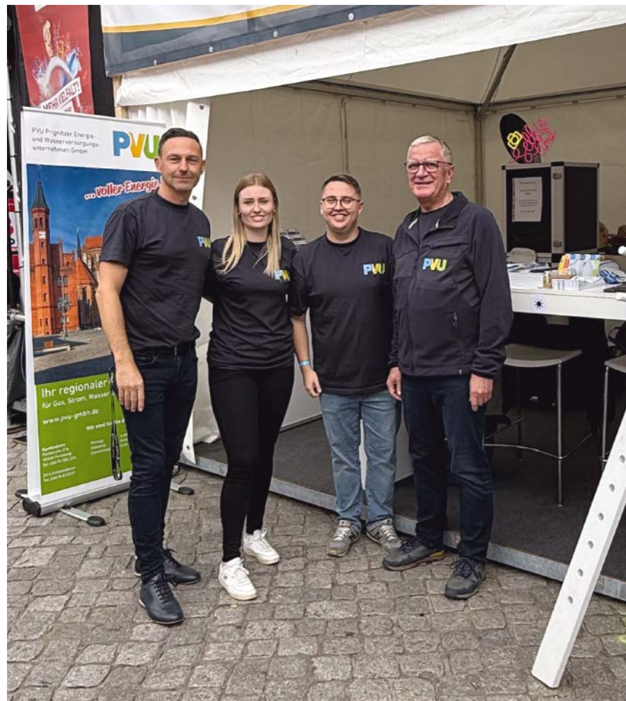
Die PVU bringt sich bei vielen Gelegenheiten in das gesellschaftliche Leben Perlebergs und der Region ein, wie hier beim Brandenburgtag 2025 in Perleberg.

hier vor Ort erklärt. Und auch jetzt kann er sie beruhigen: »Wir beobachten seit dem Februar 2026 steigende Gas- und Strompreise an den Energiebörsen. Allerdings hat PVU bereits für das laufende Jahr 2026 komplett und größtenteils auch für 2027 seine Gas-mengen preislich abgesichert«, sagt der Geschäftsführer. »Wir kaufen unsere benötigten Mengen bis zu zwei Jahre im Voraus ein, sodass kurzfristige Preiserhöhungen wie der Energiepreisschock Ende 2022 uns nur wenig aus der Ruhe bringen können.« Dieses bewährte Prinzip des Unternehmens habe den PVU-Kunden im Krisenjahr 2022 den günstigsten Preis aller Gasgrundversorger in Deutschland beschert. So mancher Kunde, der die PVU-Versorgung verlassen hat und zu einem »Discounter« mit Billigangebot gewechselt ist, hat seine Entscheidung später bereut, wenn das Lockangebot