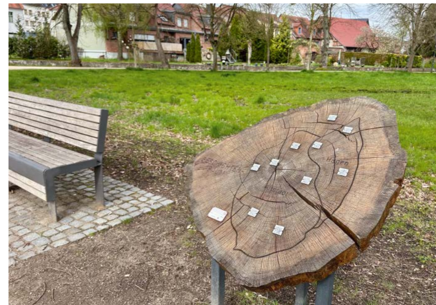
An einer Baumscheibe einer alten Eiche werden über QR-Codes per Smartphone zehn Perleberger Geschichten hörbar gemacht. Es gibt zwei solcher Baumscheiben im Stadtgebiet: am Bahnhof und hier im Hagen.