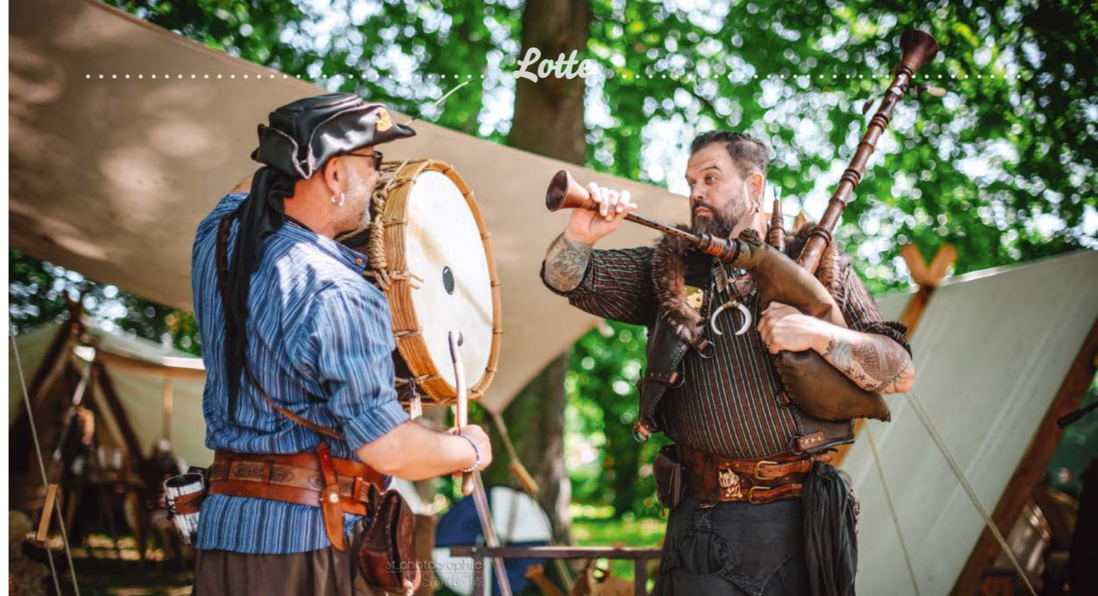
Musik und Scherzwerk gibt es vom Duo Sack und Pacc.

»Freie Clan der Bruderschaft vom Bullengraben« eindrucksvoll zeigen – hier werden Schwerter klirren und Äxte aufeinandertreffen. Doch Lotte weiß, dass hinter den wilden Kämpfen vor allem Spielfreude und die Einladung stecken, mehr über diese vergangene Zeit zu erfahren. Und dann ist da noch die geheimnisvolle Hexe Chibraxa, die mit Märchen, Mitmachgeschichten und einer Prise Zauber Groß und Klein in ihren Bann ziehen möchte. »Ergänzt wird das Programm durch die schrägen Inszenierungen von Rokus Kokus, die