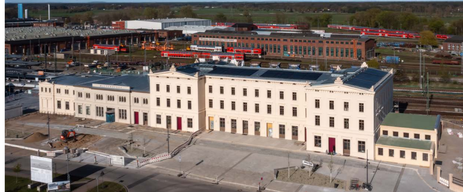
Am 13. Juni beginnt mit dem Tag des offenen Bahnhofs das sanierte und umgebaute Empfangsgebäude sein neues Leben.

machen, wenn das Empfangsgebäude am 13. Juni mit dem Tag des offenen Bahnhofs offiziell sein neues Leben beginnt. Karl wird natürlich dabei sein. Von Torsten Diehn und Martin Röhr als WGW-Projektleiter hat er erfahren, dass an dem Tag sämtliche Mieter, die sich auf den 3600 Quadratmetern im Haus Räumlichkeiten gesichert haben, einen Blick in ihre Bereiche möglich machen. Es sind die Gesellschaft für zerstörungsfreie Prüfung, das Jobcenter, die Kleinstadtakademie, die ODEG, das TGZ, das Gründerzentrum.