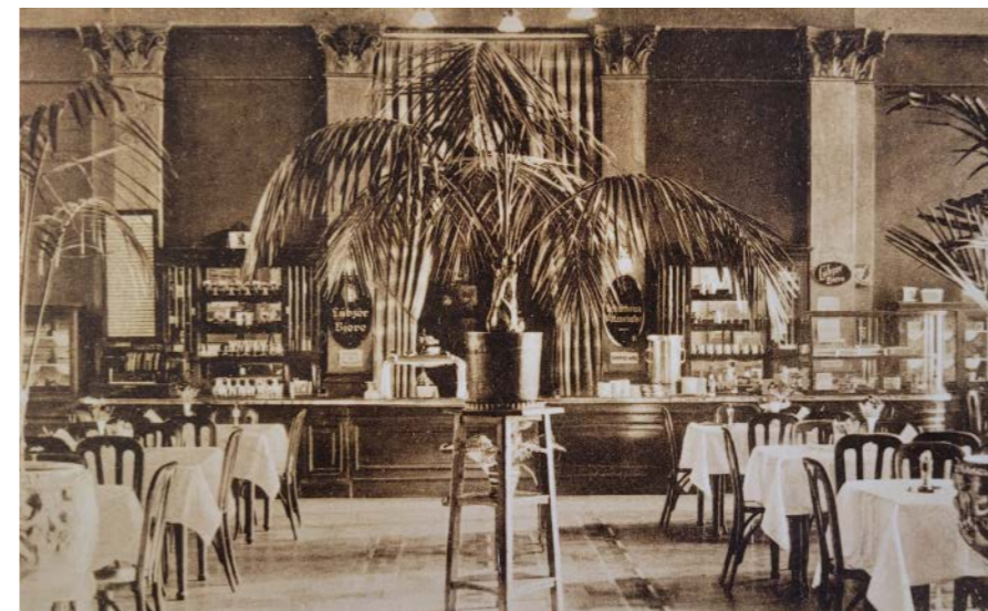
Blick in den MITROPA-Saal des Bahnhofs, wie er um 1930 aussah.