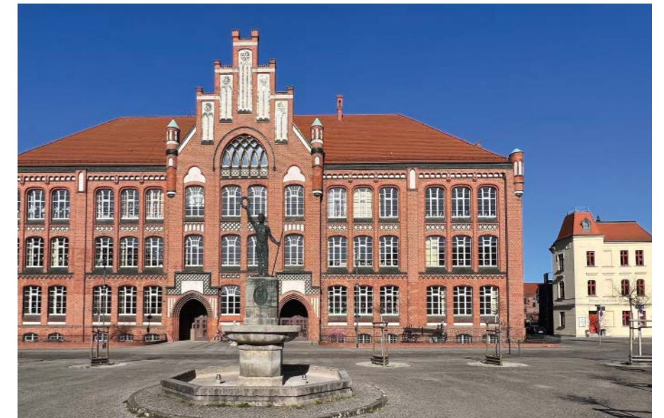
Der kleine Straßenzug rechts an der Jahnschule trägt den Namen von Nedwig, zu dessen Wirkungszeit 1907 auch das Schulgebäude errichtet wurde.

gewählter Stadtsekretär) hintertrieben. Ich erhielt nur 10 Stimmen, obgleich fast die gesamte Bürgerschaft meine Wiederwahl gefordert hatte. Von 3000 Bürgern hatten 2400 Unterschriften für mich abgegeben.«