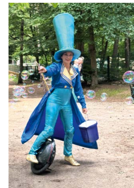
Die Unterhaltung kommt zu den Gästen, wenn sie durch den Tierpark schlendern.