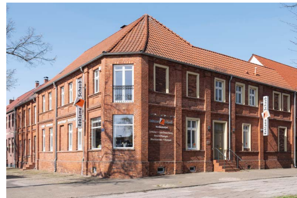
Das Werbeatelier befindet sich in der Bürgerstraße, Ecke Zimmerstraße.

der Achrom-Digitaldruckmaschine für den Großformatdruck von Mimaki. Damit können Träger wie unterschiedliche Folien, Bannermaterialien und Papiere bis zu einer Breite von 1,60 Metern ohne Naht mit Fotos, Text oder Logos bedruckt werden.