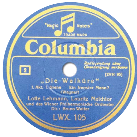
»Die Walküre« von Richard Wagner mit den Wiener Philharmonikern und Dirigent Bruno Walter wurde 1936 auf acht (!) Schellackplatten veröffentlicht. Im Tatort »Summ, Summ, Summ« von 2013 nennt Jan Josef Liefers als Prof. Dr. Dr. Karl-Friedrich Boerne Lotte Lehmann »... die einzige wahre Sieglinde«.

Und Lotte ist erstaunt, was sie bisher alles nicht wusste: Eine Fülle von Bildern zeigt Lotte Lehmann in den verschiedensten bedeutenden Rollen. In den Opern von Richard Strauss, der sie nach Wien holte, in denen von Wagner, Beethoven, Puccini, Mozart und Massenet hatte sie unvergessliche Auftritte. Während des langjähri-