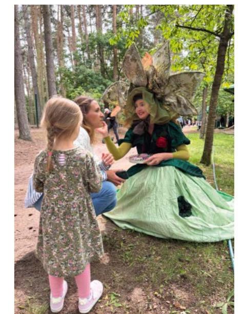
Ein tolles Familienfest mit Angeboten wirklich für Jung bis Alt ist vorbereitet.

Nachwuchs sind natürlich dabei und haben freien Eintritt zum Fest, wenn sie sich rechtzeitig im Rathaus angemeldet haben.