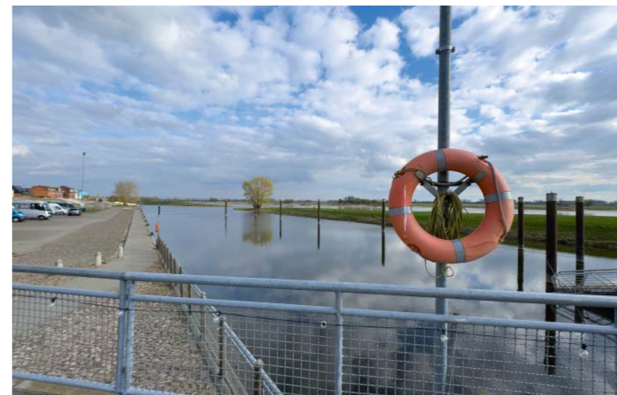
Der heutige Nedwighafen entstand als Umschlagsplatz in unmittelbarer Elbnähe. Heute ist er beliebt bei Hiesigen wie bei Touristen. Camper schätzen die Lage am Wasser.