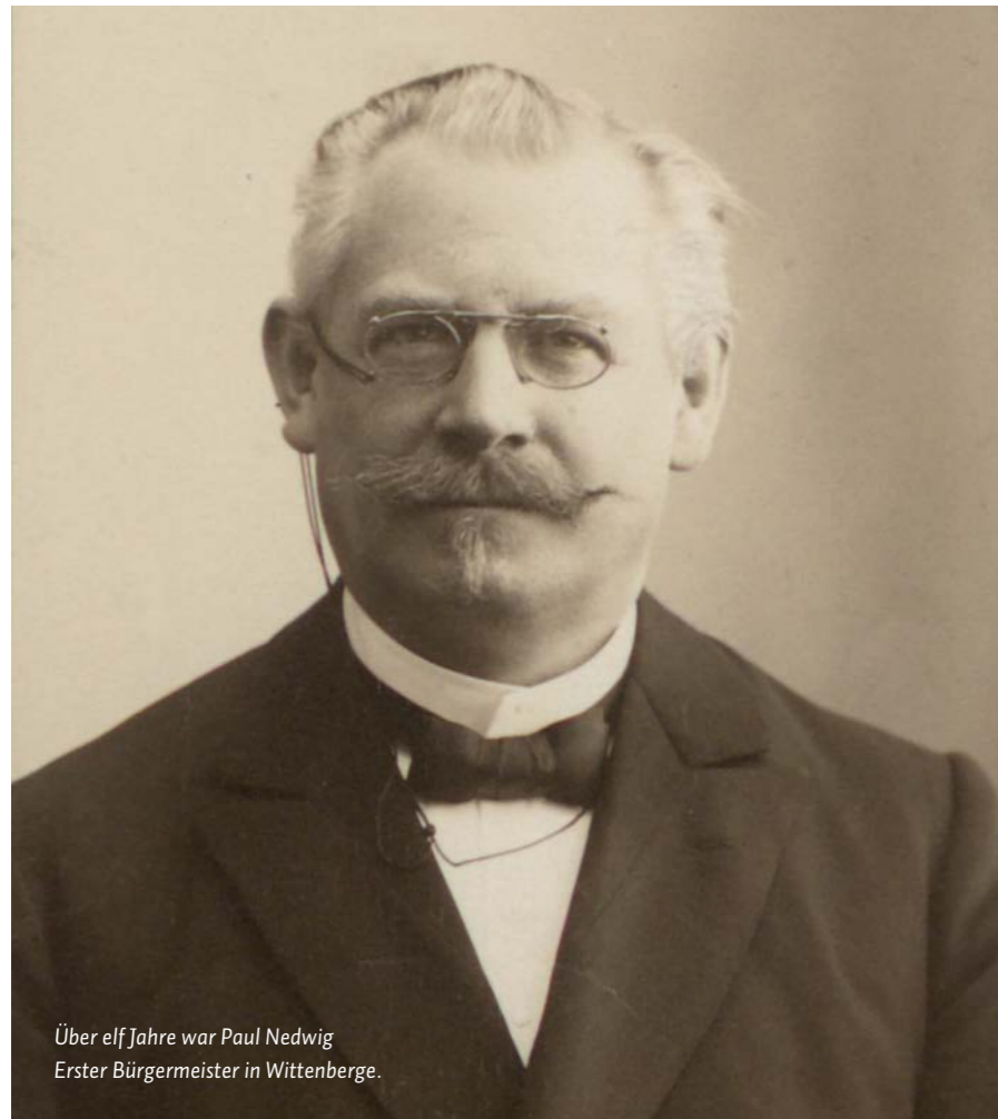
Über elf Jahre war Paul Nedwig Erster Bürgermeister in Wittenberge.