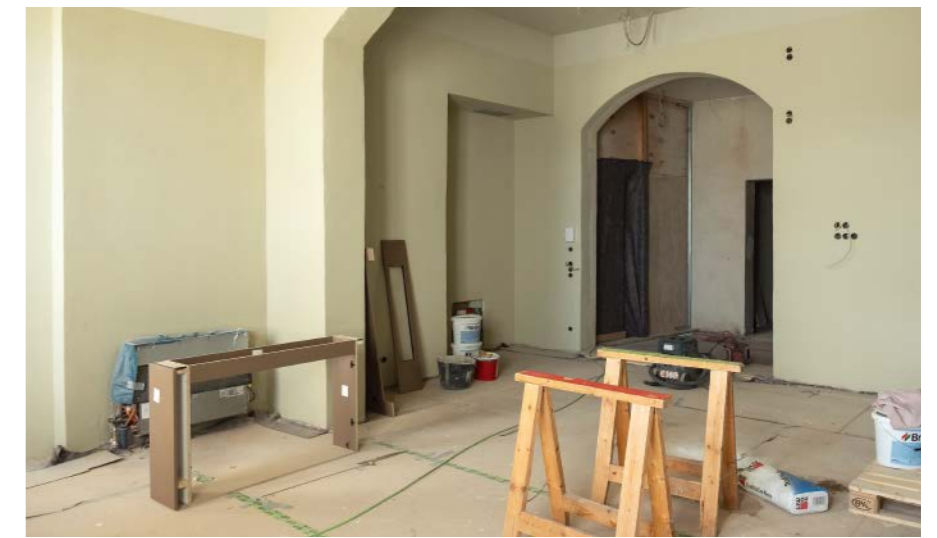
Noch haben die Handwerker in den Meetingräumen zu tun.